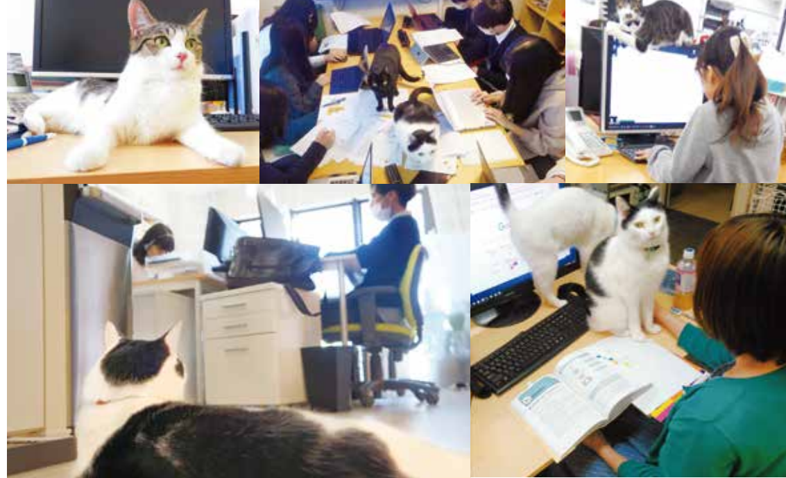
取材協力:ファーレイ株式会社 http://www.ferray.co.jp/

導入背景は、創業当時の社員が“自宅で飼っている猫が心配”という思いがきっかけでした。「家に猫がいるんだったら連れてきたら？」という代表の一言から、同伴出勤がスタート。“たまに”から“毎日”の同伴になり、制度として成り立っていきました。