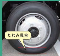
目視で「たわみ具合」をチェック