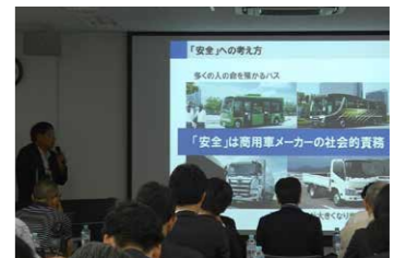
最新先進安全技術試乗会の様子

2019年は、定時株主総会や決算発表などの定例開催に加え、東京モーターショーでの情報発信や、株主様を対象に5月に「古河工場見学会」を、そしてマスコミの皆さまを対象に6月に「最新先進安全技術試乗会」を開催するなど、当社のことをより広く知っていただくための取り組みを強化してきました。今後もこのような場を通じ、社外の皆さまからいただいたご意見を企業活動に取り入れることで、企業価値のさらなる向上に努めていきます。