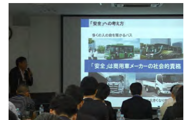
最新先進安全技術試乗会の様子

2019年は、定時株主総会や決算発表などの定例開催に加え、東京モーターショーでの情報発信や、株主様を対象に5月に「古河工場見学会」を、そしてマスコミの皆さまを対象に6月に「最新先進安全技術試乗会」を開催するなど、当社のことをより広く知っていただくための取り組みを強化してきました。今後もこのような場を通じ、社外の皆さまからいただいたご意見を企業活動に取り入れることで、企業価値のさらなる向上に努めていきます。