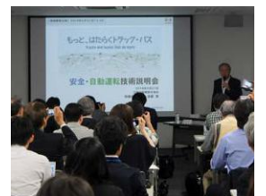
環境技術説明会の様子

日野自動車は、社外の皆さまに当社への理解を深めていただくために、企業情報の適時・適正開示と、それらに基づくコミュニケーションが重要であると考えています。2018年は、定時株主総会や決算発表などの定例開催に加え、株主様を対象に6月に「技術説明会」を、そしてマスコミの皆さまを対象に5月に「安全・自動運転技術説明会」、7月に「環境技術説明会」を開催するなど、当社のことをより広く知っていただくための取り組みを強化してきました。今後もこのような場を通じ、社外の皆さまからいただいたご意見等を企業活動に取り入れることで、企業価値のさらなる向上につとめていきます。