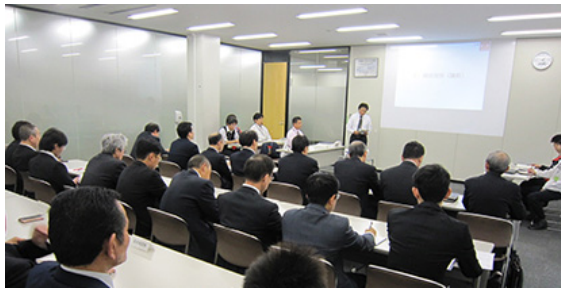
国内関連会社生産環境会議

2014年度も継続的に実施している国内グループ関連会社の環境リスク低減活動に関する各社レベルアップのため、幹事会社に集まり、環境リスク評価手法の再教育や環境リスク対策事例を現地現物で共有する「相互研鑽会」や、互いの会社で実際に行なった対策事例や新たな評価結果を監査し合う「相互監査会」を開催し、「見合う、見せ合う」ことで相互のレベルアップ、コミュニケーションをはかりました。