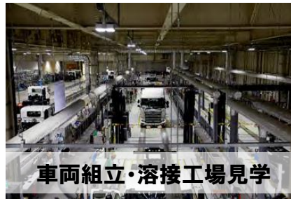
車両組立・溶接工場見学