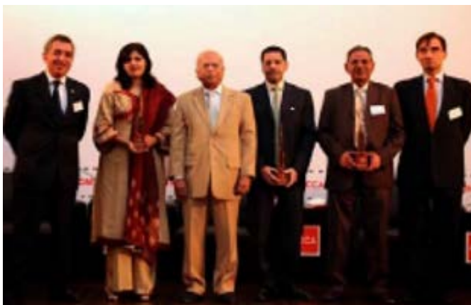
HPMLの環境レポート表彰式