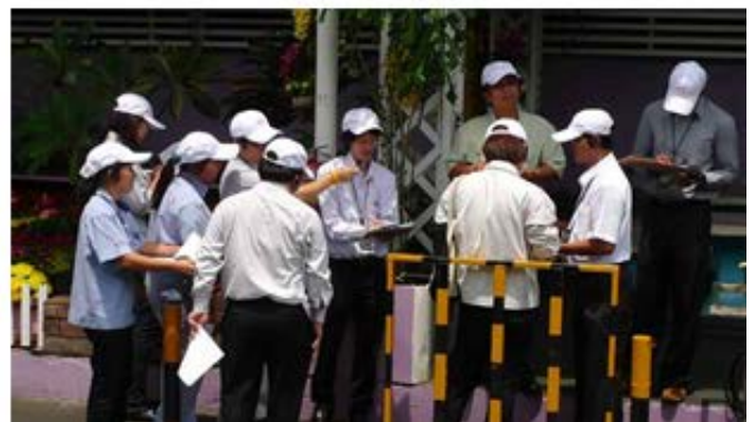
東南アジアエリア会議