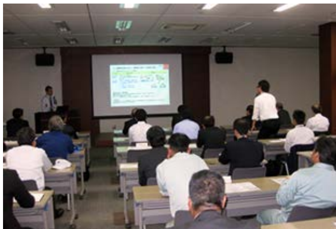
国内関連会社生産環境会議

また、社内各部署、および関連会社の参加による「環境展」を開催し、改善事例のパネルや環境改善活動における情報の共有、相互研鑽を図っております。なお、最優秀事例には表彰状と記念品が授与されました。