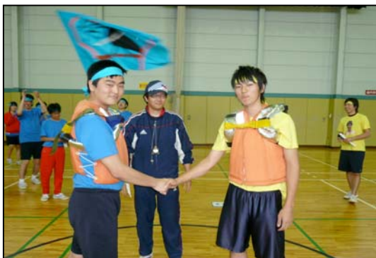
パワーホース決勝

最後に全員リレーがあり、総合得点の発表の時間がきました。結果は、1位黄組、2位赤組、3位青組と、黄組の逆転優勝でした。閉会式が終わると、盛大な胴上げをして平成21年度日野学園体育祭が終了しました。