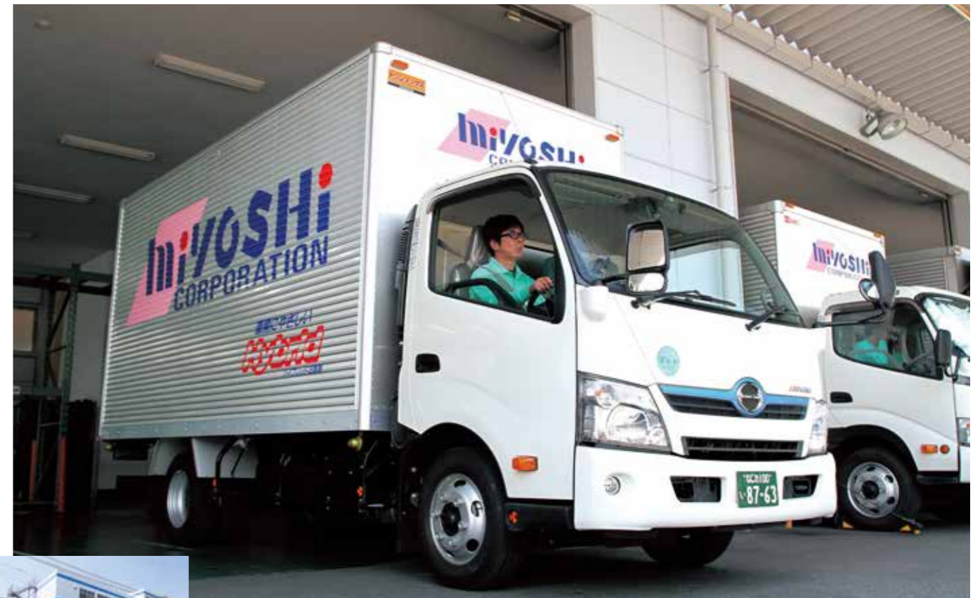
午後の出庫に備える日野デュトロハイブリッド。